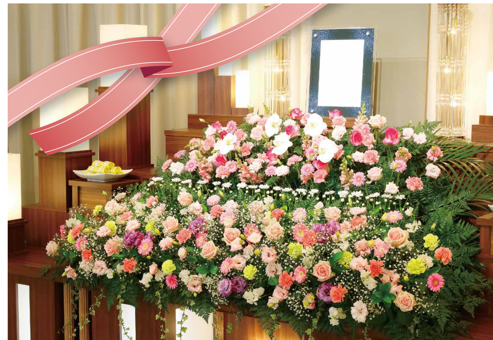
△最新プランのご紹介【thequeB レディースプラン】たくさんのお花で飾られた祭壇で、優しく華やかに見送る女性のためのプランです。