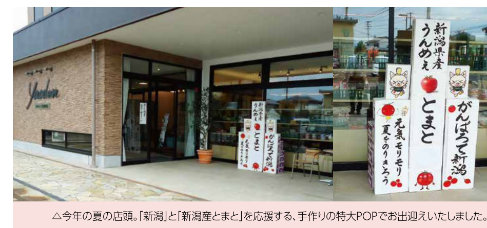
△今年の夏の店頭。「新潟」と「新潟産とまと」を応援する、手作りの特大POPでお迎えいたしました。

新型コロナウイルス感染症により影響を受けられた皆様には、謹んでお見舞い申し上げますとともに、安全と一刻も早い終息を願っております。また、感染予防の対策として、ご来店いただく際の【マスク着用】と【手指消毒】にご協力いただけますよう、よろしくお願いたします。