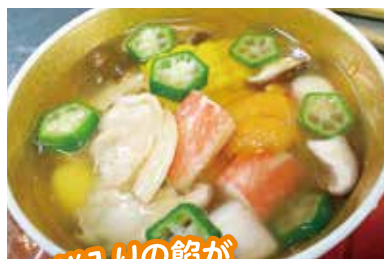
海鮮入りの餡が 贅沢な茶碗蒸しです

〈ワンポイント〉 強火で蒸し過ぎると、膨れ上が り“すが入って”しまいます。茶 碗蒸しの表面に膜が張ったら、 忘れずに弱火にしましょう!