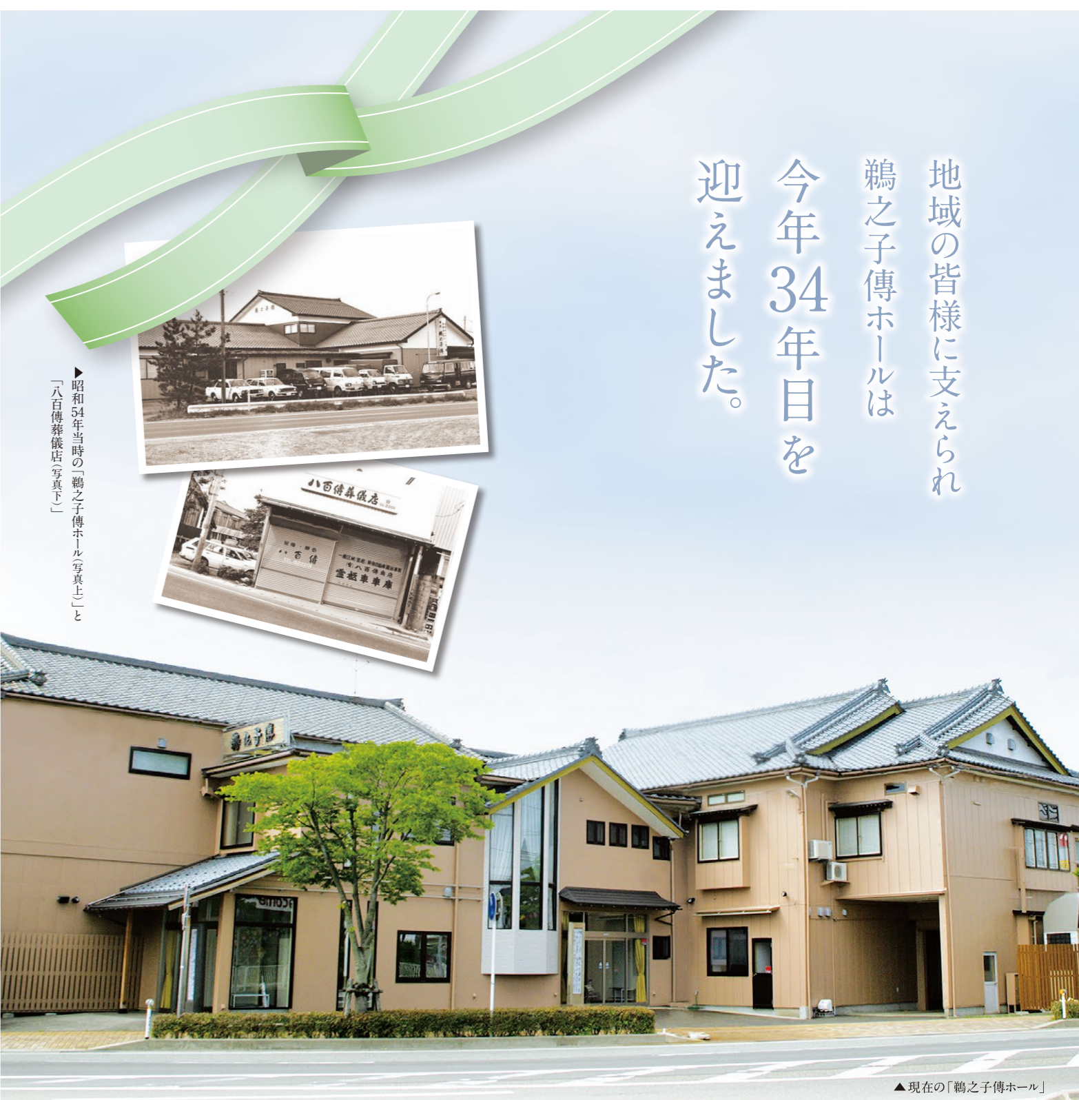
▶昭和54年当時の「鶺鴒之子傳ホール写真上」 「八百傳葬儀店(写真下)」

セレモニーテークつたえ 検索 http://www.yaoden.co.jp H25.1